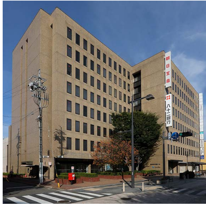
長野表参道ビル 外観